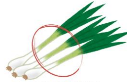
TALLO DE LA CEBOLLETA

BRÉCOL: cortando los extremos y la corteza del tallo y picando el interior, tendremos la base para un sofrito. Queda muy rico en un potaje de lentejas o en una sopa con zanahoria y fideos.