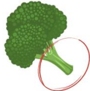
TALLO DEL BRÉCOL

En muchas ocasiones tiramos partes comestibles de verduras porque no sabemos aprovecharlas o se nos pierden en la nevera pequeñas porciones porque no se nos ocurre cómo aprovecharlas, aquí tenemos algunas sencillas ideas para reducir el desperdicio de verduras.