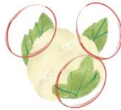
HOJAS DE LA COLIFLOR